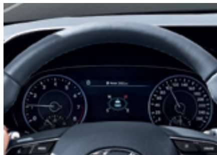
מסך TFT LCD בגודל 7"