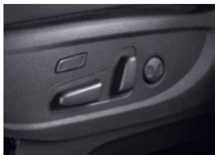
מושב נהג חשמלי