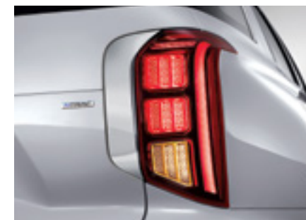
פנסים אחוריים LED