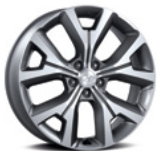
חישוק סגסוגת 20"