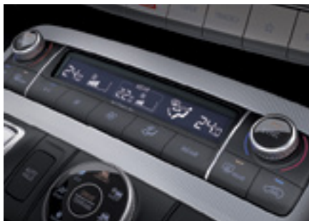
בקרת אקלים תלת איזורית