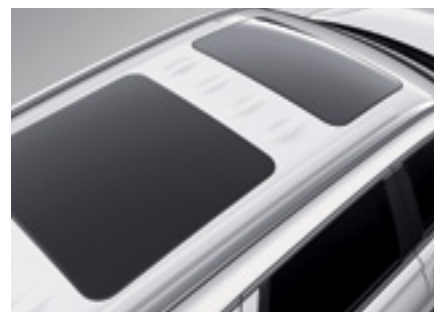
גג שמש פנורמי נפתח כפול*