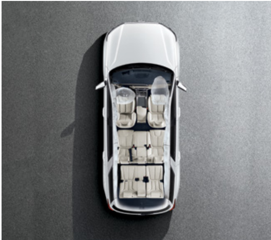
7 כריות אוויר

יונדאי פליסייד מצויד ב-Hyundai SmartSense, מערכות בטיחות מתקדמות המבוססות על טכנולוגיות הבטיחות האקטיבית העדכניות ביותר, כדי להעניק לכם יותר בטיחות ויותר שקט נפשי.