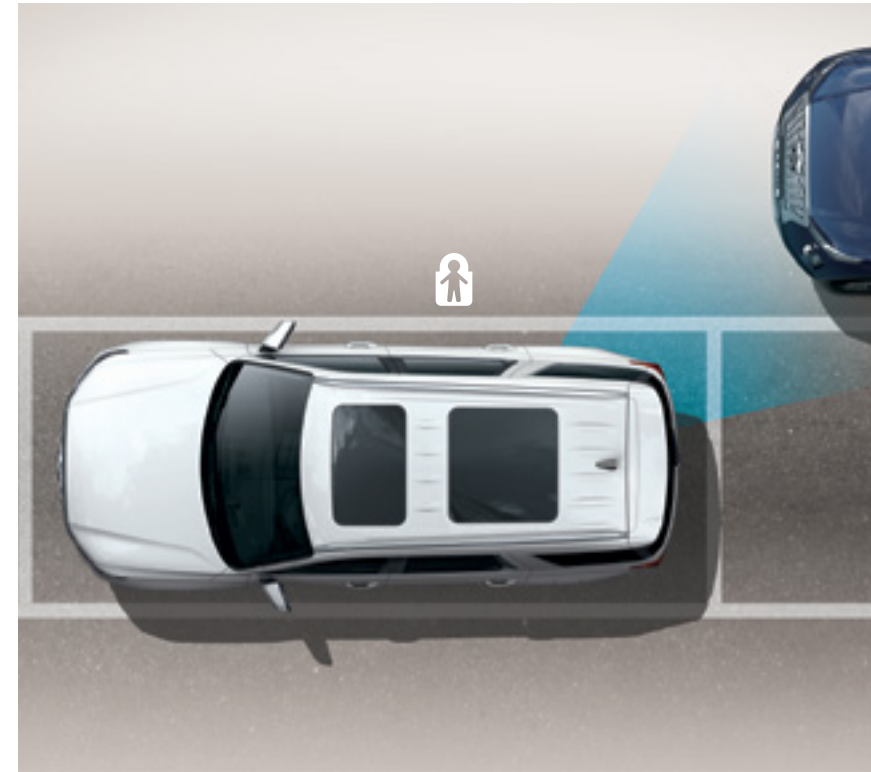
מערכת יציאה בטוחה מחנייה (SEA)

מערכת אקטיבית להתרעה ומניעת פגיעה ברכב חוצה בעת נסיעה לאחור.