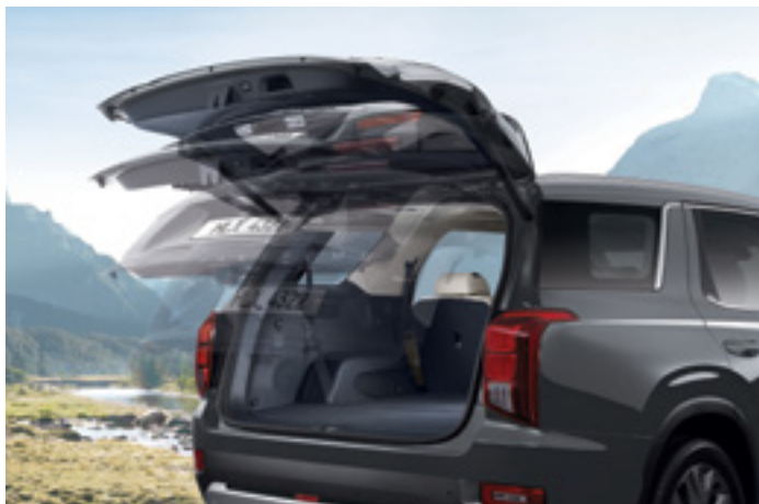
דלת תא מטען חשמלית חכמה

אם תעמדו ליד חלקו האחורי של הרכב למשך 3 שניות כאשר המפתח החכם נמצא אצלכם, דלת תא המטען תיפתח אוטומטית, כדי לאפשר לכם להוציא חפצים מהרכב בקלות ובנוחות. תוכלו לכוון את הגובה המקסימלי שבו דלת תא המטען תיפתח על ידי כוונת דלת תא המטען לגובה הרצוי ולחיצה על לחצן הסגירה והחזקתו לחוץ לפרק זמן מסוים.