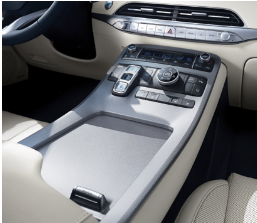
קונסולה גבוהה צפה

אם תעמדו ליד חלקו האחורי של הרכב למשך 3 שניות כאשר המפתח החכם נמצא אצלכם, דלת תא המטען תיפתח אוטומטית, כדי לאפשר לכם להוציא חפצים מהרכב בקלות ובנוחות. תוכלו לכוון את הגובה המקסימלי שבו דלת תא המטען תיפתח על ידי כוונת דלת תא המטען לגובה הרצוי ולחיצה על לחצן הסגירה והחזקתו לחוץ לפרק זמן מסוים.