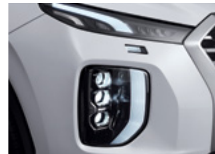
פנסים ראשיים מסוג LED