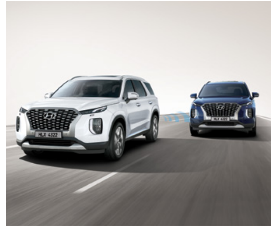
מערכת אקטיבית לזיהוי ומניעת התנגשות בכלי רכב ב"שטח מת" (BCA)

מערכת "יציאה בטוחה" המתריעה ומונעת פתיחת דלתות המושב האחורי במקרה של רכב חוצה.