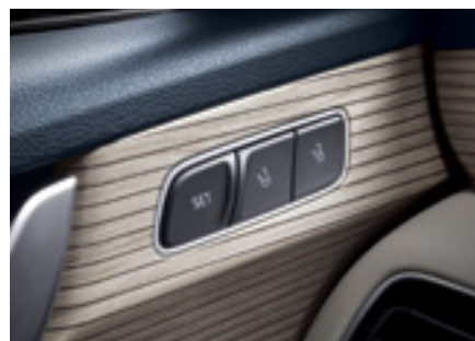
זכרונות למושב נהג*