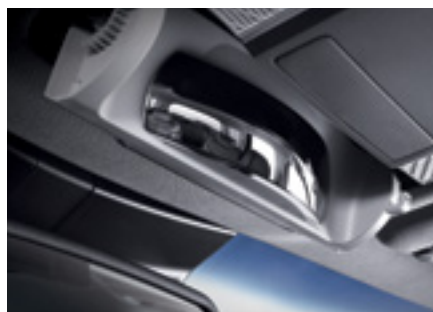
מראה פנורמית לפני הרכב