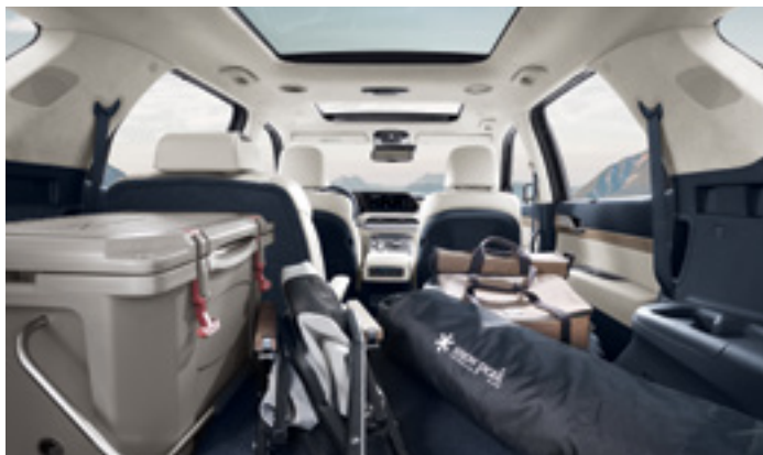
תא מטען מרווח (בקיפול מושבי השורה השלישית)