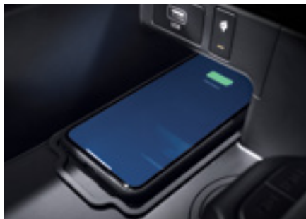
משטח טעינה אלחוטי