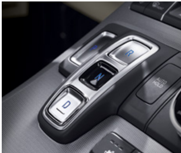
בחירת הילוך נסיעה בלחיצת כפתור (SBW)