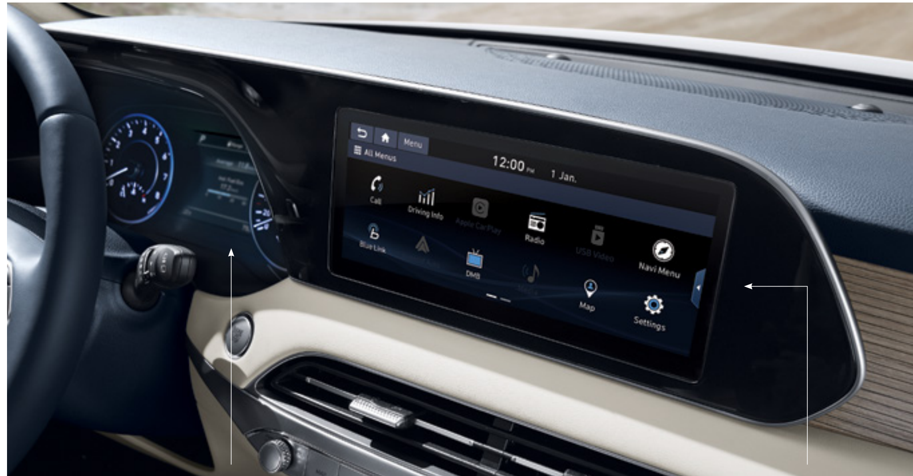
מחשב דרך צבעוני 7"