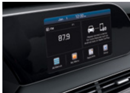
מערכת מולטימדיה עם מסך בגודל 8"