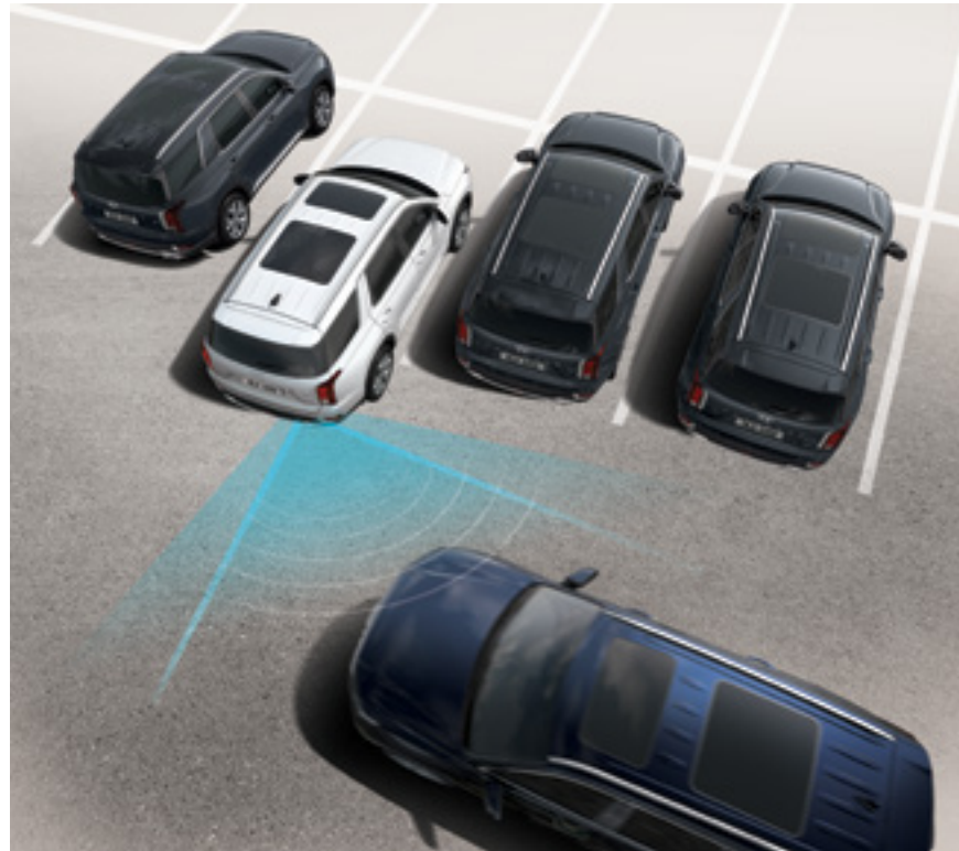
התרעה ומניעת פגיעה ברכב חוצה מאחור (RCCA)

מערכת אקטיבית להתרעה ומניעת פגיעה ברכב חוצה בעת נסיעה לאחור.