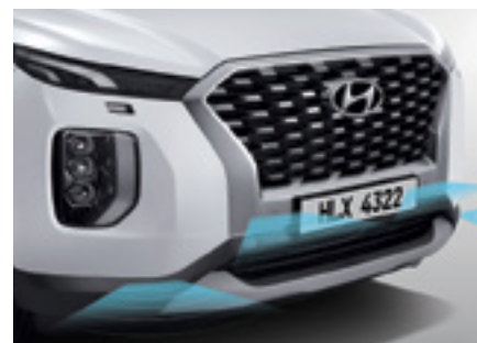
חיישני חניה קדמיים + אחוריים מקוריים