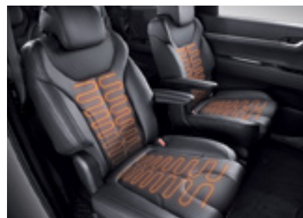
חימום מושבים קדמיים ואחוריים