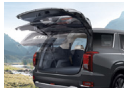
דלת תא מטען חשמלית חכמה