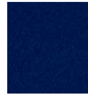
2X (כחול מטלי)