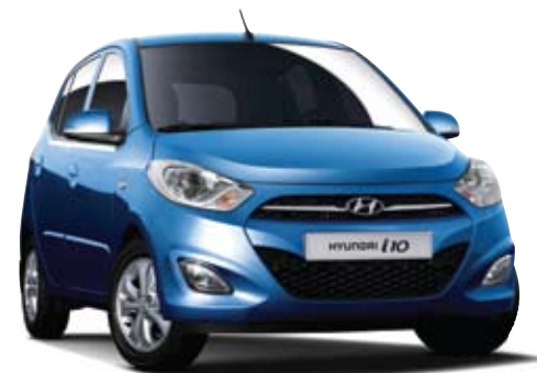
* הצבעים הינם להמחשה בלבד ועלולים להיות פערים בין הצבעים בקטלוג לבין המציאות

*נתוני היצרן, עפ"י בדיקת מעבדה. תקן EEC/80/1268 **המדד מחושב לפי תקנות "אוויר נקי" (גילוי נתוני זיהום אוויר מרכב מנועי בפרסומת), התשס"ט 2009